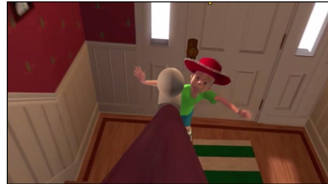
punto de vista