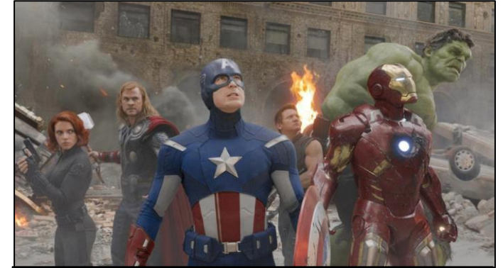
un plano con grupo