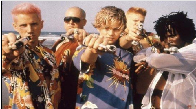
plano a la altura de los ojos