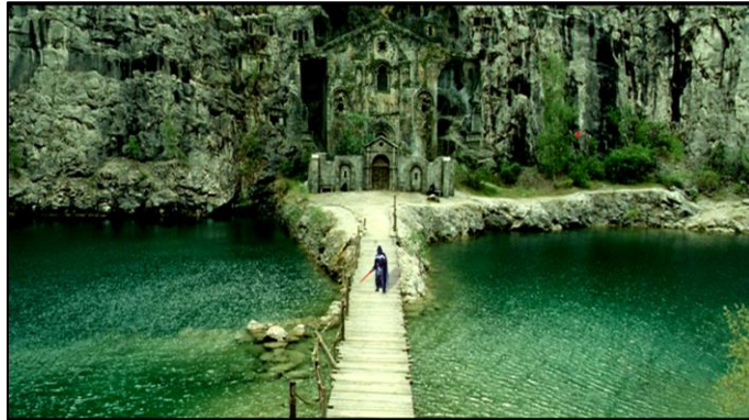
primer plano largo