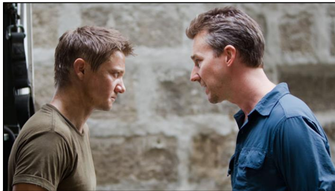
un plano medio