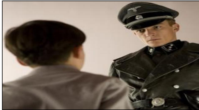
un plano contrapicado