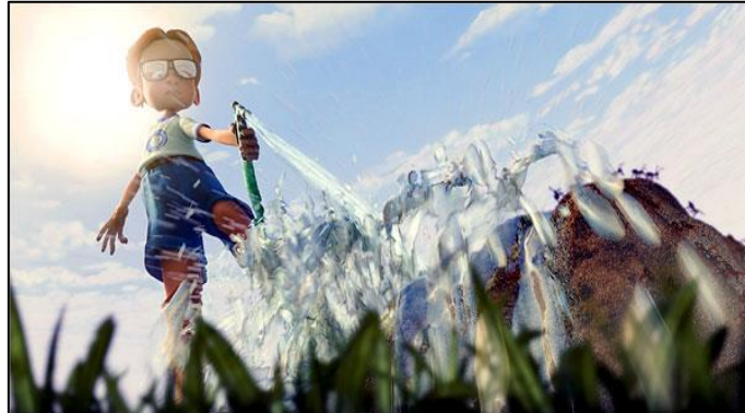
un plano nadir