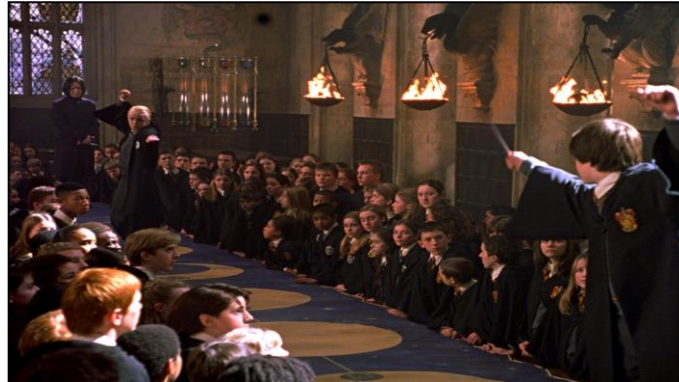
un plano largo