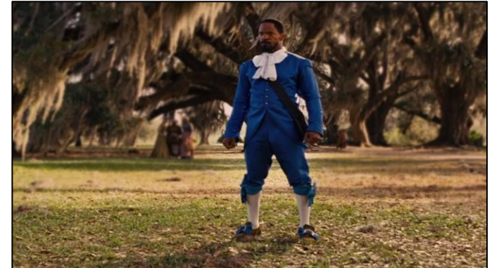
un plano general