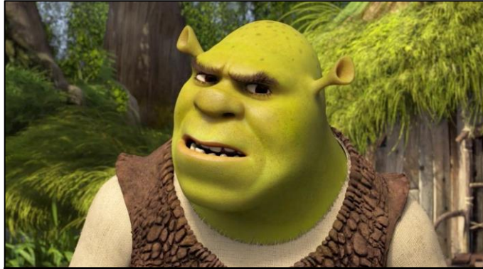
un plano con uno