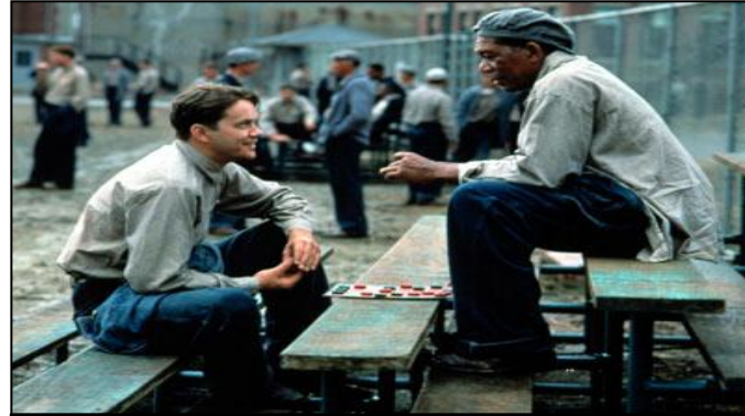
un plano con dos