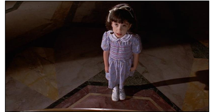
un plano picado