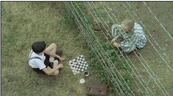
un plano cenital