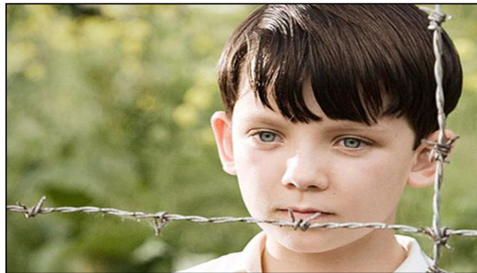
un primer plano