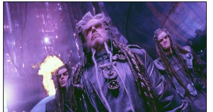
un plano holandés